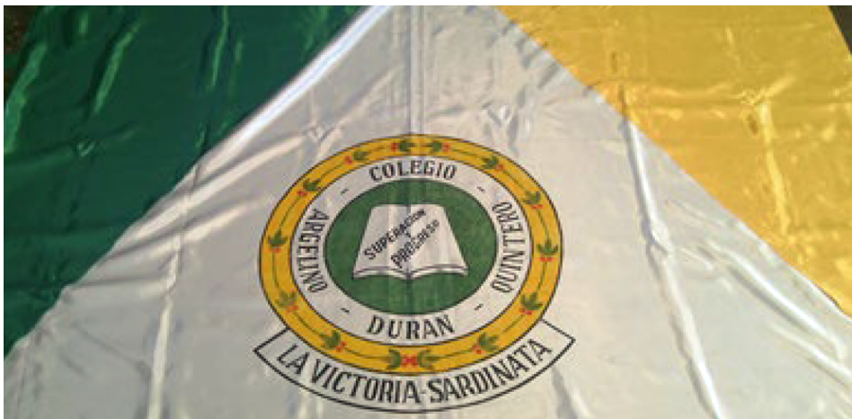
Figura 5. Escudo Colegio Argelino Durán Quintero

El cuarto símbolo destacado es la bandera del colegio, que se presenta a continuación: