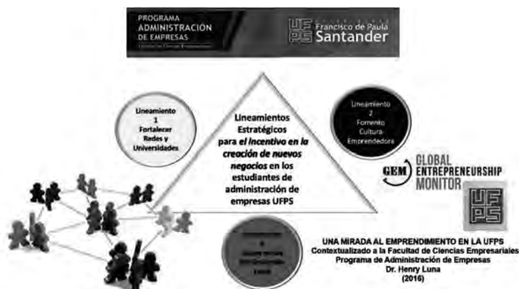
Figura 96. Lineamientos Estratégicos para el incentivo en la creación de nuevos negocios en los estudiantes de Administración de Empresas UFPS siguiendo la metodología GEM

Para apoyar esta iniciativa se puede justificar ante la difusión estratégica de los casos de éxito como hechos motivantes para los jóvenes estudiantes en las cátedras de emprendimiento para apropiarse estrategias que consoliden este proceso en cada una de las universidades.