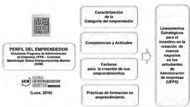
Figura 94. Perfil del Emprendedor

A continuación se presentan las respuestas obtenidas con respecto a los objetivos. Esto es producto de los hallazgos y análisis del instrumento aplicado con la metodología GEM a los estudiantes del programa de Administración de Empresas UFPS.